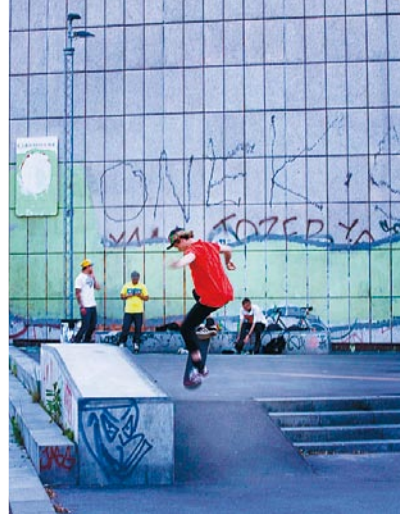
Längs med Den Grønne Sti kommer man nära inpå stadens liv och puls.