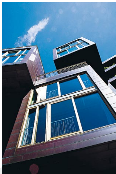
Tietgenkollegiet, ett ultraelegant studentboende i koppar och trä i DR Byen.