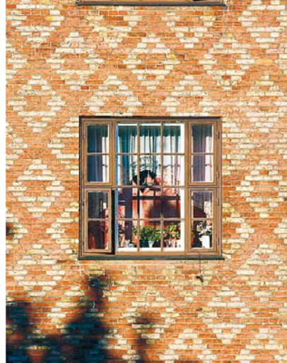
En typisk "Bacon-fasad". Namnet syftar på mönstret i teglet.