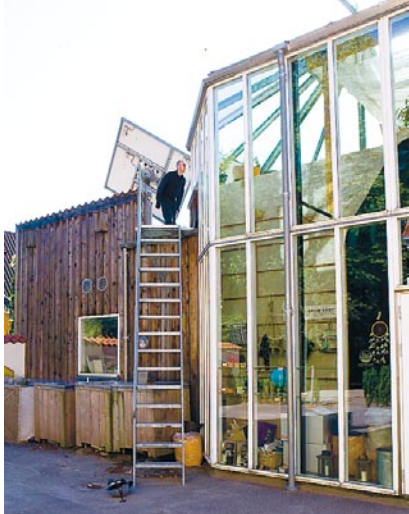
På Det Økologiske Inspirationshus kan man gå på guidad tur.