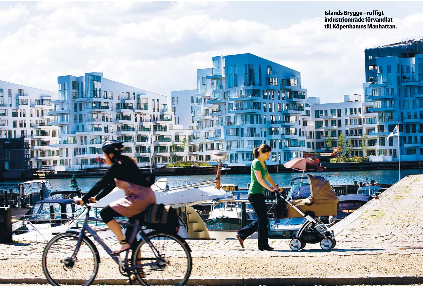
Islands Brygge - ruffigt industriområde förvandlat till Köpenhamns Manhattan.