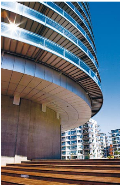
En gammal silo har blivit förvandlad till bostadshus på Islands Brygge.