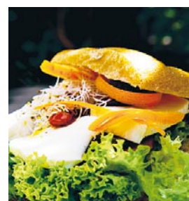
Matig macka på trevliga lunchstoppet Kvartershuset.