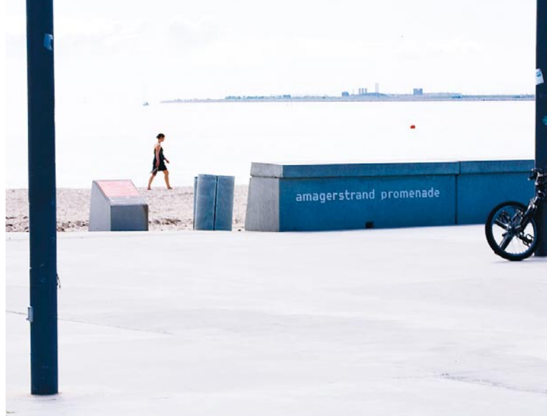
Amager Strand har en stram och konsekvent estetik där betongen spelar huvudrollen.